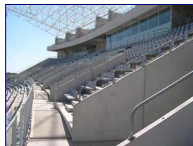
Estadio de Atletismo de Málaga.

Estadio de Atletismo de Antequera. Gradas, peldaños y losas prefabricadas.