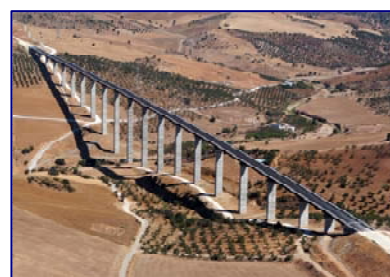
LAV Viaducto Arroyo de las Piedras Álora (Málaga) Huelva.