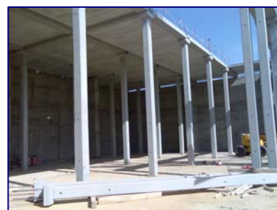
Depósito "El Conquero". Huelva.