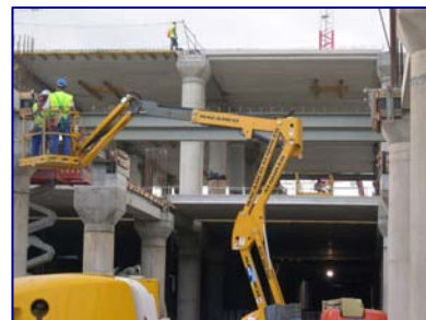
Nueva Terminal Aeropuerto Málaga