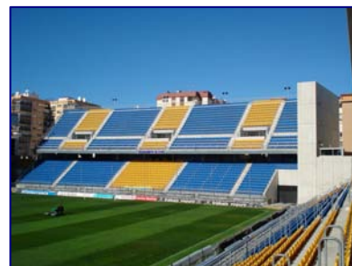
Estadio Ramón de Carranza. Cádiz.

Estadio Ramón de Carranza. Cádiz. Gradas, peldaños, losas y paneles de fachada.