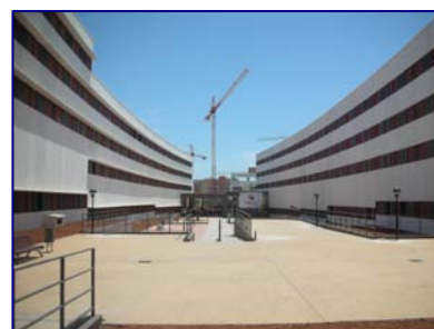
182 viviendas VPO. Málaga.

182 viviendas VPO. Málaga. Paneles prefabricados de fachada.