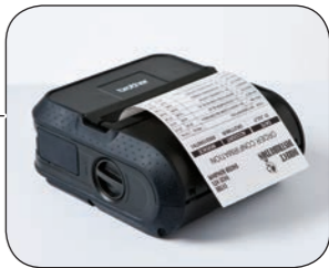
La tecnología térmica directa altamente fiable, utiliza un reducido número de piezas, obteniendo bajos costes de mantenimiento y funcionalidad.