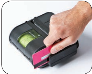
Añada un lector de tarjetas magnéticas opcional para procesar las transacciones con tarjetas de crédito.