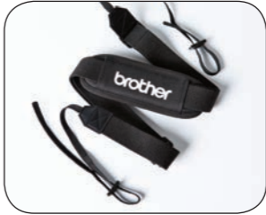
Disponibles dos correas para llevarla colgada o clips para el cinturón de forma que facilite la movilidad cuando se imprime en exteriores.