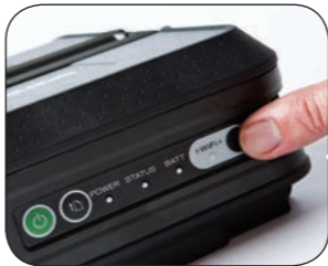
Opciones de conexión por USB, serie, bluetooth o red wi-fi

El diseño ligero, compacto y ergonómico de la serie RJ, permite colocar la impresora en lugares donde el espacio es reducido, y hay accesorios disponibles para su instalación en vehículos o para llevarla contigo de un lugar a otro.