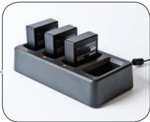
Existen diferentes opciones de alimentación incluyendo baterías recargables, adaptadores CA o kits de alimentación de vehículos.