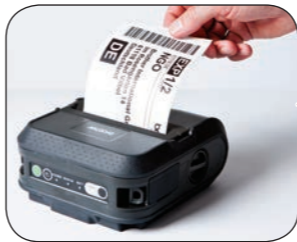
Versátil - imprime tanto recibos como etiquetas de hasta 118 mm de ancho.