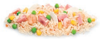
ARROZ 5 DELICIAS RIZ 5 DÉLICES 5 DELIGHTS RICE

Arroz blanco, fiambre de cerdo, gamba pelada, champiñón laminado, guisante, maíz y pimiento rojo.