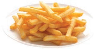
PATATA FRITA CLÁSICA POMME FRITE CLASSIQUE CLASSIC FRENCH FRIES 10 / 10 mm

Ref. 04907898 / 10 x 1 K Ref. 04907458 / 4 x 2,5 K Ref. 04905458 / 4 x 2,5 K