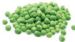
GUISANTE / PETIT POIS / PEAS

Ref. 04401605 / 10 x 1 K (AA) cn Ref. 04401604 / 4 x 2,5 K (AA) cn Ref. 04401620 / 4 x 2,5 K (Extrafino) BASIC Ref. 04404396 / 10 x 1 K (A) Ref. 04401610 / 4 x 2,5 K (A) BASIC Ref. 04405053 / 4 x 2,5 K (fino) BASIC Ref. 04401624 / 4 x 2,5 K BASIC