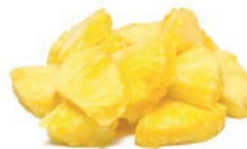
PIÑA / ANANAS / PINEAPPLE Trozos / Morceaux / Pieces 1/12