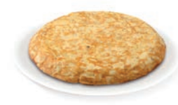
TORTILLA DE PATATA CON CEBOLLA / OMELETTE DE POMME DE TERRE À L'OIGNON / POTATO OMELETTE WITH ONIONS

Ref. 06705731 / 10 x 750 G (Circular - 22 cm diámetro) Ref. 06706399 / 12 x 750 G (Rectangular - 21 x 27 cm)