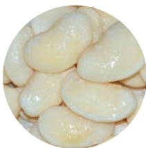
GARROFÓN / HARICOT DE LIMA LIMA BEANS