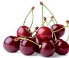
CEREZAS CERISE CHERRY