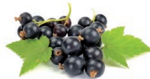
GROSELLA NEGRA CASSIS BLACK CURRANT

Ref. 06405465 / 5 x 1 K ❄️ Ref. 06405542 / 5 x 1 K (25 x 35)