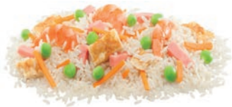
ARROZ 3 DELICIAS + TORTILLA RIZ 3 DÉLICES + OMELETTE 3 DELIGHTS RICE + OMELETTE

Arroz blanco, fiambre de cerdo, zanahoria, gambas, guisantes y tortilla.