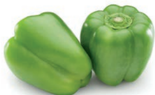
PIMIENTO VERDE / POIVRON VERT GREEN PEPPER