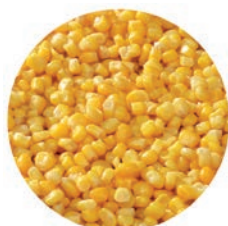
MAIZ DULCE / MAIS DOUX / SWEET CORN