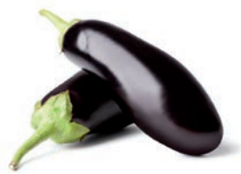
BERENJENA / AUBERGINE / EGGPLANT

Dados / En dés / Diced (10 x 10) Ref. 04204775 / 4 x 2,5 K ❄️