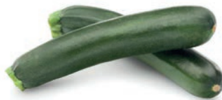
CALABACÍN / COURGETTE / COURGETTE

Dados / En dés / Diced 10x10 Ref. 02800755 / 4 x 2,5 ❄️