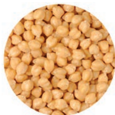
GARBANZOS POIS CHICHE CHICKPEA

Ref. 06302741 / 12 x 450 G ❄️ Ref. 063027384 / 4 x 2,5 K ❄️