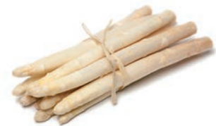
ESPÁRRAGO BLANCO / ASPERGE BLANCHE / WHITE ASPARAGUS