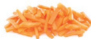
Bastones / Bâtonnets / Wedges Ref. 05704109 / 4 x 2,5 K ❄️