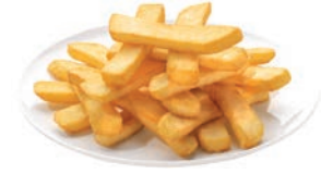
PATATA FRITA STEAKHOUSE POMME FRITE STEAKHOUSE STEAKHOUSE FRENCH FRIES 10 / 20 mm