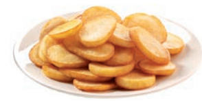
PATATA RODAJA "DÓLAR" POMME FRITE RONDELLES PREFRIED POTATO SLICES