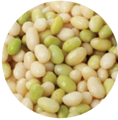
ALUBIA POCHA HARICOT "POCHA" "POCHA" WHITE BEANS