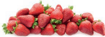
FRESA ENTERA FRAISE ENTIERE WHOLE STRAWBERRY

Ref. 06405465 / 5 x 1 K ❄️ Ref. 06405542 / 5 x 1 K (25 x 35)