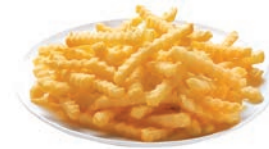
PATATA FRITA ONDULADA "CRINKLE CUT" POMME FRITE "CRINKLE COUPE" "CRINKLE CUT" FRENCH FRIES 9 / 9 mm