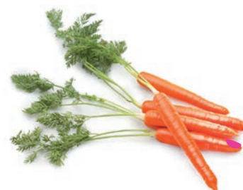
ZANAHORIA / CAROTTE / CARROT