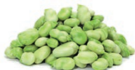
HABAS SUPERBABY FÈVE SUPERBABY SUPERBABY BROAD BEAN (< 12 mm)