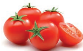
TOMATE / TOMATE / TOMATO