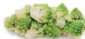
ROMANESCO / CHOU ROMANESCO ROMANESCO BROCCOLI