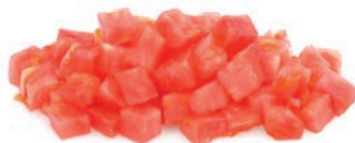
Dados / En dés / Diced (10x10) Ref. 06204164 / 4 x 2,5 K ❄️ (con piel / avec pelure / skinon)