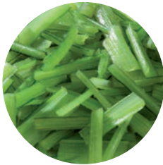
BORRAJA / BOURRACHE / BORAGE

Ref. 06002631 / 5 x 1 K ❄️ Ref. 06005370 / 12 x 450 G ❄️