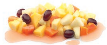
FRUTAS TROPICALES FRUITS EXOTIQUES TROPICAL MIX

Ref. 06405448 / 5 x 1 K ❄️ Ref. 06405448 / 5 x 1 K ❄️