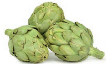
ALCACHOFA / ARTICHAUT / ARTICHOKE