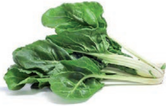
ACELGA HOJA FEUILLE DE BLETTE SWISS CHARD LEAVES