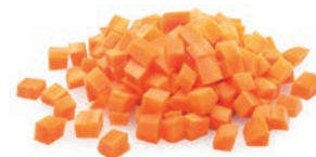
Dados / En dés / Diced (10x10) Ref. 05702533 / 4 x 2,5 K ❄️