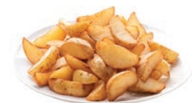
PATATA GAJO ESPECIALADO POMME FRITE QUARTERS AUX HERBES SEASONED PREFRIED POTATO WEDGES Con piel / avec pelure / skin on