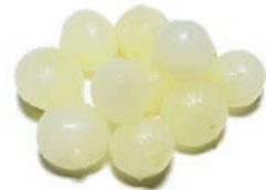
CEBOLLITA PERLA / OIGNON GRELOT / SILVER SKIN ONION

Lonchas / En lamelles / Long sliced Ref. 03206436 / 6 x 1 K ❄️