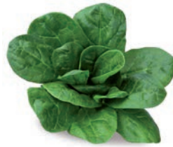
ESPINACA HOJA PORCIONES ÉPINARD FEUILLE PORTIONS LEAF SPINACH PORTIONS (50 g)