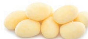
PATATA PARISINA POMME DE TERRE PARISIENNE PARISIAN POTATOES