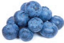
ARANDANOS MYRTILLE BLUEBERRY