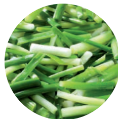
AJO TIERNO / AIL TENDRE YOUNG GARLIC