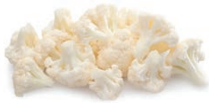
COLIFLOR FLORETES CHOU-FLEUR FLEURETTES CAULIFLOWER FLORETS

Ref. 03601452 / 10 x 1 K (40/60) cn Ref. 03601449 / 4 x 2,5 K (40/60) BASIC Ref. 03601463 / 4 x 2,5 K (50/70) Ref. 03604103 / 4 x 2,5 K (5/20) 4 x 2,5 K (50-70) / ECOLÓGICO