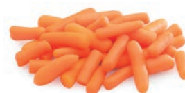
Baby Ref. 05702537 / 4 x 2,5 K (6/14 mm) ❄️ Ref. 05702540 / 10 x 1 K (6/14 mm) ❄️ Ref. 05702600 / 4 x 2,5 K (14/20 mm) ❄️ BASIC