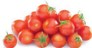
TOMATE CHERRY TOMATE CERISE CHERRY TOMATO