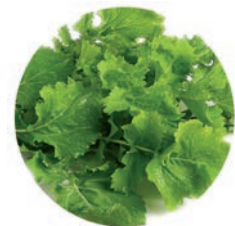
GRELOS / FANE DE NAVET / GRELOS Porciones 50 g / portions 50 g