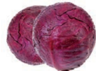
COL ROJA / CHOU ROUGE / RED CABBAGE