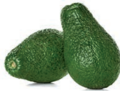
AGUACATE / AVOCAT / AVOCADO

Ref. 02900929 / 10 x 1 K (30-50) CN Ref. 02900809 / 4 x 2,5 K (40-60) ❄️ Ref. 02903347 / 4 x 2,5 K BASIC Ref. 02908006 / 4 x 2,5 K (50-70) ECOLÓGICO