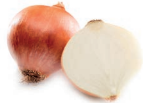
CEBOLLA / OIGNON / ONION