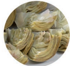
Trozos / Morceaux / Chopped Hearts

Corazones / Coeurs / Hearts Ref. 02300593 / 10 x 1 K CN