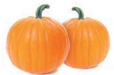
CALABAZA PELADA / POTIRON PELÉ / PUMPKIN PEELED

Ref. 06002631 / 5 x 1 K ❄️ Ref. 06005370 / 12 x 450 G ❄️