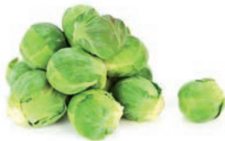
COLES DE BRUSELAS / CHOU DE BRUXELLES / BRUSSELS SPROUTS

Ref. 03601452 / 10 x 1 K (40/60) cn Ref. 03601449 / 4 x 2,5 K (40/60) BASIC Ref. 03601463 / 4 x 2,5 K (50/70) Ref. 03604103 / 4 x 2,5 K (5/20) 4 x 2,5 K (50-70) / ECOLÓGICO