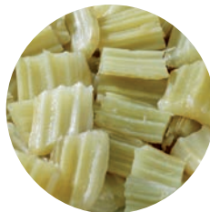
CARDO / CARDON / CARDOON