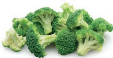
BROCCOLI FLORETES BROCOLI FLEURETTES BROCCOLI FLORETS

Ref. 02900929 / 10 x 1 K (30-50) CN Ref. 02900809 / 4 x 2,5 K (40-60) ❄️ Ref. 02903347 / 4 x 2,5 K BASIC Ref. 02908006 / 4 x 2,5 K (50-70) ECOLÓGICO