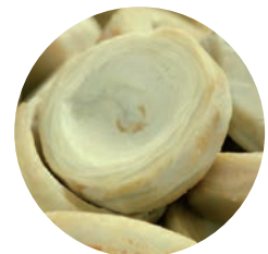
Fondos / Fondos / Fondos (50/70)