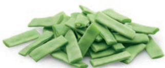
JUDIA VERDE PLANA HARICOT VERT PLAT GREEN ROMANO BEANS

Ref. 04601918 / 10 x 1 K ❄️ Ref. 04601913 / 4 x 2,5 K ❄️ Ref. 04602024 / 4 x 2,5 K ❄️ BASIC