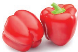
PIMIENTO ROJO / POIVRON ROUGE RED PEPPER