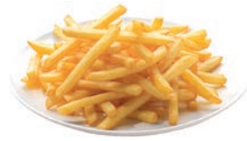
PATATA FRITA JULIENNE POMME FRITE JULIENNE JULIENNE FRENCH FRIES 7 / 7 mm