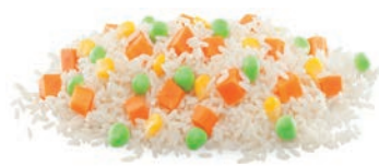
ARROZ MIX RIZ MIX RICE MIX

Arroz blanco, zanahoria, guisante y maíz. Riz blanc, carotte, petit pois et maïs. White rice, carrots, peas and corn.