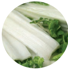
ACELGA PENCA / CÔTE DE BLETTE / SWISS CHARD STEMS

Ref. 02105374 / 10 x 1 K ❄️ Ref. 02100571 / 4 x 2,5 K ❄️