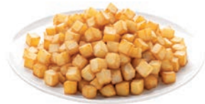
PATATA FRITA DADOS POMME RISSOLÉE PREFRIED DICED POTATOS 12 / 12 mm