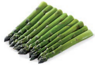
ESPÁRRAGO VERDE ENTERO ASPERGE VERTE ENTIERE WHOLE GREEN ASPARAGUS

Ref. 04401605 / 10 x 1 K (AA) cn Ref. 04401604 / 4 x 2,5 K (AA) cn Ref. 04401620 / 4 x 2,5 K (Extrafino) BASIC Ref. 04404396 / 10 x 1 K (A) Ref. 04401610 / 4 x 2,5 K (A) BASIC Ref. 04405053 / 4 x 2,5 K (fino) BASIC Ref. 04401624 / 4 x 2,5 K BASIC