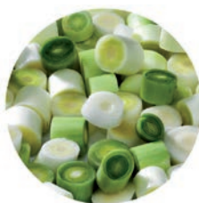
PUERRO / POIREAU / LEEK