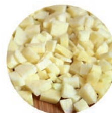
PATATA / POMME DE TERRE / POTATOES