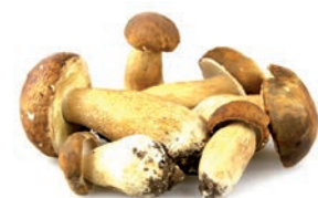
BOLETUS EDULIS Dados / En dés / Diced (25x25)