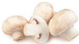
CHAMPIÑÓN / CHAMPIGNON DE PARIS / PARISIEN MUSHROOMS