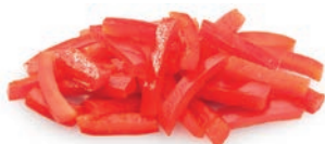
Tiras / Lamelles / Strips Ref. 05102204 / 4 x 2,5 K ❄️