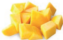
MANGO MANGUE MANGO Dados / En dés / Diced 25x25