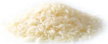
ARROZ BLANCO PRECOCIDO RIZ BLANC PRÉ-CUIT PRE-COOKED WHITE RICE