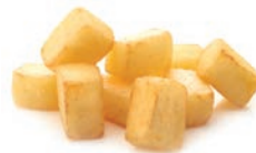
PATATA FRITA "BRAVAS" POMME FRITE "BRAVAS" "BRAVAS" PREFRIED POTATO