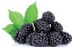
MORA MÛRE BLACKBERRY